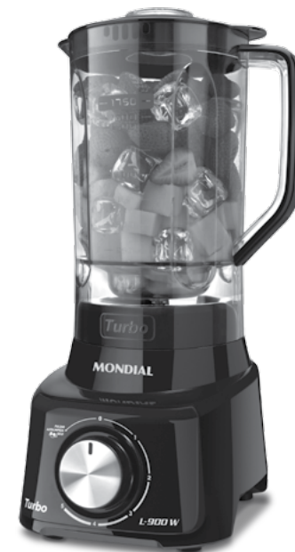
L-900 FB / L-900 FR / L-900 FR 2C